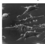
Макрофаги, стремящиеся (Под воздействием активных полисахаридов) к очагу раковых клеток