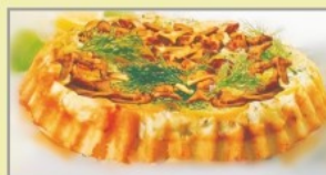
На 4-6 порций:

При подаче рис выложите на блюдо, сверху уложите телятину с грибами и соус из петрушки.