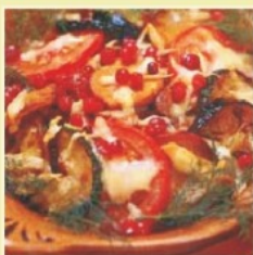
(на 4 порции)

Мясо оленя, вепря и утки нарезать соломкой, обжарить 5-7 минут на подсолнечном масле. Добавить предварительно отваренные и нарезанные лисички, а также нарезанный соломкой лук и треть помидоров. В обжаренную массу влить сливки, перемешать и выпаривать до загустения.